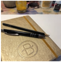
Tagebuch und Stift