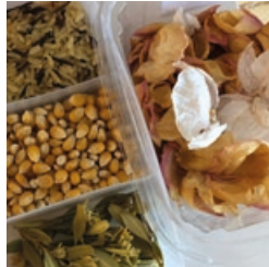
Blätter und Blüten