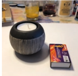
Kerze und Streichhölzer