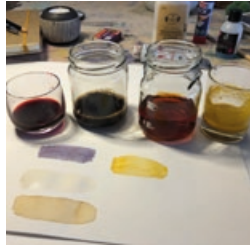
Tee, Kaffee, Kurkuma, Beeren