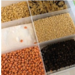
Linsen, Nudeln, Reis