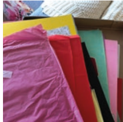
Collage-Papiere / Verpackung