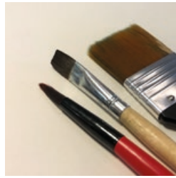
2-3 verschiedene Pinsel