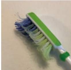
zum Farben spritzen