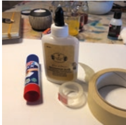
Kleber & Co.